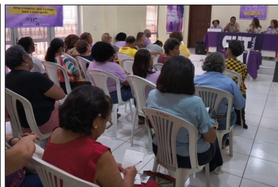
Ato realizado no Largo do Carmo; Roda de Conversa na sede da CUT e Atividade no Sintsprev