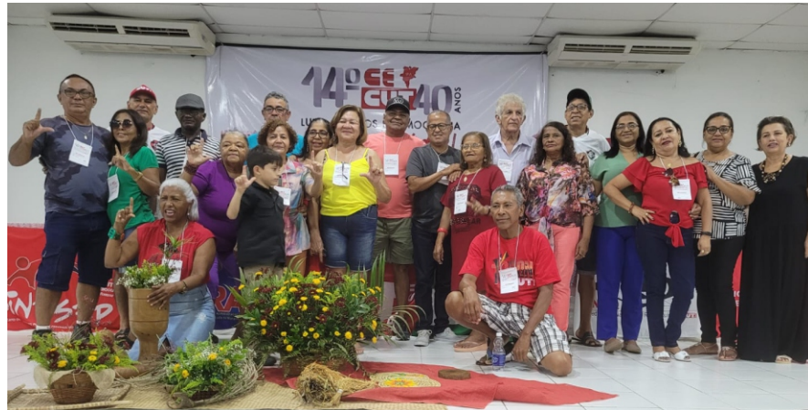
Nova diretoria eleita

O Congresso celebra 40 anos da Central e da luta unificada em defesa dos trabalhadores e das trabalhadoras, marcando ainda o ano de retorno de um operário sindicalista à Presidência do Brasil e a retomada de nossa democracia. O SintsprevMa estará presente nesse momento histórico.